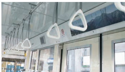
鉄道車両の内装材